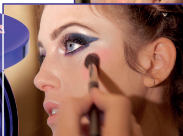
Rose Bonne Mine & Pearly Porcelain