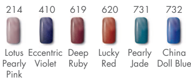
214 Lotus Pearly Pink, 410 Eccentric Violet, 619 Deep Ruby, 620 Lucky Red, 731 Pearly Jade, 732 China Doll Blue

Spielen Sie mit Farbe! 6 neue Nuancen mit ultimativen Schimmer für einen perfekten Look!