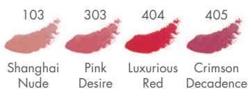
103 Shanghai Nude, 303 Pink Desire, 404 Luxurious Red, 405 Crimson Decadence

Tragen Sie 404 Luxurious Red mit PUPA's Lippenpinsel auf.